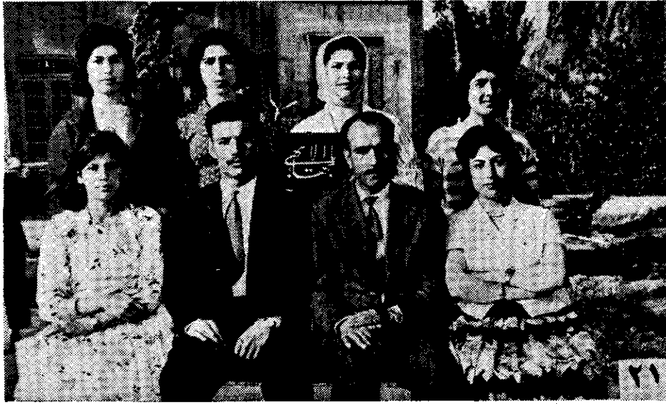
لجنه جوانان بهائى مياندا آب - ۱۱۷ بدیع