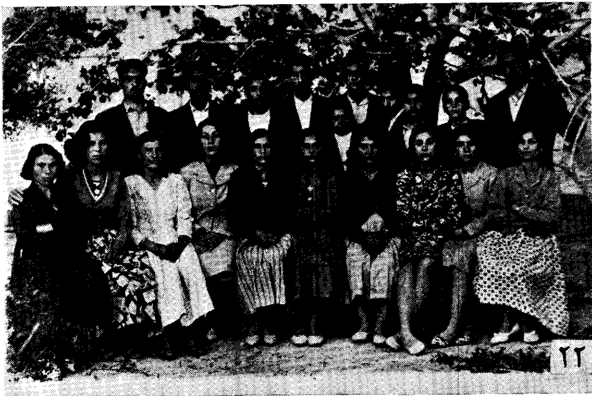
جمعی از جوانان عزیز بهائى خاش - سنه ۱۱۸ بدیع